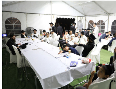
חסידות מסביב לשעון - במירון שיעור חסידות בשעות הלילה המאוחרות במאהל החסידות במירון, בשנים עברו

שלהבות האש המרצדות, האוחזות מידי שנה בליל ל"ג בעומר במדורות הקרשים, מפיצים את אורם וחומם למסביב, ומעלים על נס, את שמו של בעל השמחה הגדולה, התנא האלוקי, רבי שמעון בר יוחאי.