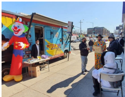
גאווה יהודית בחוצות ניו יורק

זעקתו של הרבי שליט"א מלך המשיח ומחלמתו העיקשת כנגד כל אלו המבקשים לקעקע את שלימותו של העם, קיבלה השבוע תזכורת כואבת, בהחלטת בג"ץ להכיר ב"גיורים" ובטקסים מזוייפים כאילו העושים אותם יחשבו ליהודים.