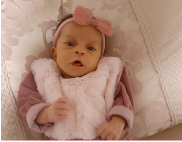
התינוקת הבריאה. בזכות האמונה

"עליך לחתום על החיים שלך! מרגע זה כל האחריות מוטלת על כתפך!", אמרו הרופאים. בלב מלא אמונה היא חתמה על המסמך המפחיד