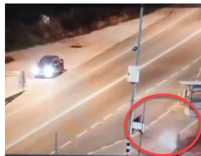
אסור שמראות כאלו יחזרו מחבל משליך בקבוק תבערה לעבר חייל שלא מגיב לו. צילום מתוך מצלמות האבטחה

באם מישו חשב שכוחות הביטחון אכן נחלשו כל כך, התברר ביום שני, כי מול נערים יהודיים הם פועלים בנחישות גדולה, גדולה מידי. במהלך מרדף, פגע רכב משטרתי לכאורה ברכבם של קבוצה שנחשדה כי חבריה מחו על אולת היד הממשלתית והביאו להריגתו של אחד מהם, תוך שהשוטרים עוברים על החוק ומסרבים לאפשר להתקרב לשטח ולבדוק מה אירע שם.