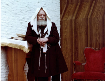
הרבי שליט"א מלך המשיח

עם תחילת תקופת החששות מנגיף הקורונה, התיחזקה בליבה של הדר, כמו אצל יהודים רבים וטובים, ההרגשה שהנה הנה הרבי שליט"א משיח צדקנו מתגלה ומביא לכולנו את הגאולה האמיתית והשלימה