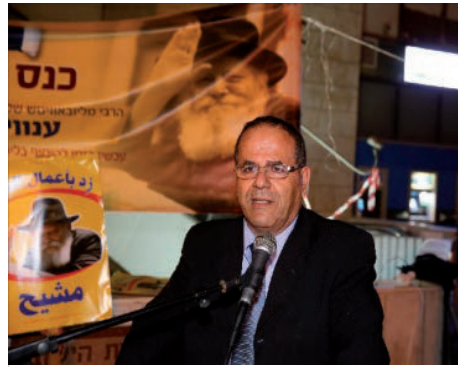
איוב קרא, סגן השר לשיתוף איזורי, נואם באירוע

מכריז "יחי אדוננו מורנו ורבינו מלך המשיח לעולם ועד", בערבית עם הקהל. הרב בועז קלי - תיאר את הקמפיין החדש "הוסף במעשים טובים" שבוודאי יפעל את זירוז הגאולה האמיתית והשלימה. למעוניינים לסייע בפרויקט, טל': 052-570-7707.