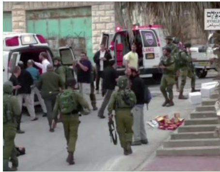
זירת דקירת החייל בחברון

ראינו מחבלים שדורסים אזרחים חפים מפשע, יורדים מהרכב ודוקרים את אלו שרק רגע לפני דרסו, וגם כאשר יורים בהם כדור ועוד כדור, מצליחים לקום שוב ושוב, ומנסים להמשיך לדקור. ראינו מקרים בהם מחבל הצליח לרצוח איש ביטחון אשר ניסה לעצור אותו, ירה על מנת לפצוע ולא על מנת להרוג, ולבסוף שילם על כך בחייו.