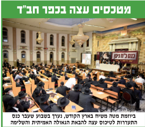
מטנסים עצה בכפר חב"ד

בשיחת הדבר מלכות' השבועית, כחלק מהלימוד של עניני הגאולה, ובהבנה מחודשת של המצב בו אנו נמצאים - 'ימות המשיח', מגלה הרבי שליט"א מלך המשיח כי הגענו לשלב בו אפשר להפוך לצדיק: "על ידי זה שישנו כח העצמות בגוף הגשמי (של יהודי), כנ"ל, הרי זה נותן את הכח שגם למטה יגיעו לדרגות הכי גבוהות, עד "תהי צדיק" . . לאחר כל הענינים - של בירור וזיכוכ כו' - שבני ישראל עברו במשך הדורות, יכול