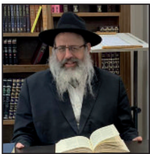
הרב זלמן לנדא

חשוב לציין כי לאורך כל שלבי ההקמה, קיבלו מנהלי הישיבה, תשובות וברכות מהרבי שליט"א מלך המשיח, באמצעות האגרות קודש, מה שנתן אור ירוק לכל המהלך.