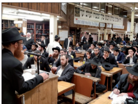
שיעור ב-770 במסגרת המבצע

תוכנית המבצע בנויה על צבירת נקודות, כאשר בכל שלב זכאים לקבלת סט ספרים נחשק ומשתלם יותר; בין החבילות: סט דבר מלכות