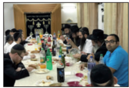
התועודות יום הולדת

אגב, לצד יום ההולדת הפרטי - יום הלידה, הרי שחסידים