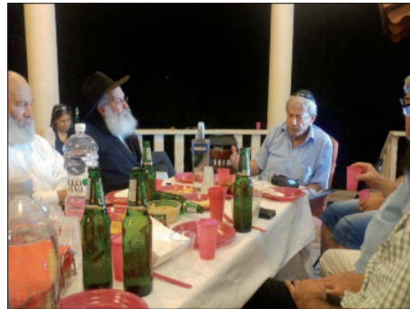
חוגגים יום הולדת בהפתעה

אין ספק שדווקא בדורנו, זוכים לגלות את תכלית ירידת הנשמה למטה ביום ההולדת, בעבודתו האישית של כל אחד בהבאת הגאולה האמיתית והשלימה.