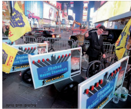
שיירת אופני אור הגאולה במנהטן

בחול המועד של חג הסוכות האחרון, התקיימה שיירת האופניים בניו יורק במשך שני ימים. השנה היה חידוש מיוחד בשיירה – אופני פדי-קאב (pedicab) – אופניים בהם נוהגים לעשות שירות מוניות לתיירים. השיירה הסתובבה יום שלם בכל רובע ברוקלין. כשלמחרת הסתובבה השיירה במנהטן שם הביאו את מצוות ארבעת המינים