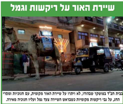
בבית חב"ד פושושק שבהודו, לא ויתרו על שיירת האור מקומית, עם חנוכיית ומסרי החג, על נבי ריקשות כשראש השיירה צעד גמל ועליו חנוכה מאירה.

מבחינה זו, הרי שאחד משיאי הפרשה, הכולל גם את אחת מהוראותיה החשובות ביותר עבורנו, נמצא בתחילתה, במפגש גורלי של "ויגש אליו יהודה". היה זה לאחר שהגביע ש"נגנב" מבית יוסף, נמצא באמתחת בנימין ולכן עליו להשאר כעבד ליוסף. יהודה ניגש עם כל עוצמתו כמלך השבטים, לדבר קשות עם יוסף, משנה למלך מצרים, על כל הסיפור.