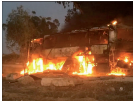
האוטובוס הבוער

ארגון חמאס מיהר להפיץ תיעוד וידאו בו ניתן לראות את ירי טיל הקורנט לעבר האוטובוס. הירי המסוכן ביותר, שגרם לפירוקו של האוטובוס לחתיכות, בוצע רגעים אחדים לאחר שירדו ממנו עשרות חיילים. לא ברור האם המחבלים חיכו שהאוטובוס יחשף במלואו ואכן חשבו שהוא מלא בחיילים, או שמא לקח להם להתארגן במשך מספר דקות בהם הם צילמו את האירוע, אך הירי בוצע ב"ה מאוחר. גם פרשנים שונים שיסו להסביר כי מדובר במהלך מכוון של המחבלים, מודים כי