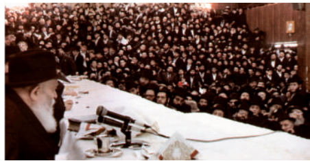
"גרת", "גר אנוכי בארץ".

וההכנה היא - "עם לבן גרתי" - הידיעה הברורה אשר כל העולם הזה ומלואו אינם אלא בדרגת