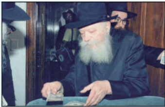
הרבי שליט"א מלך המשיח בחלוקת הדולרים

כשהעיר אותו, התברר עצרו המיוחד מכך שלמרות רצונו העז,