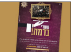
פרסום ההרשמה לקבוצת הבנות לתשרי

גם באירוע שמחת בית השואבה הענק, הנערך כל לילה ברחובות השכונה, עד לשעה 6 בבוקר, ניתן להן מקום בעזרת הנשים. כאן, כמו בבית המקדש בשעתו, כאשר חז"ל תיקנו