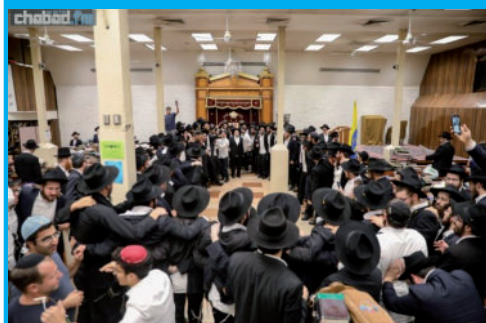
בריקודי שמחה, פתחו השבוע מאות 'תמימים' את שנת הלימודים 'בקבוצה' המגיעה ללימודים אצל הרבי שליט"א מלך המשיח.