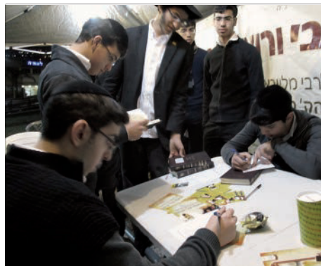
דוכן האגרות ע"י ציון הרמב"ם

זו הפעם הראשונה בה יכולו לצפות בהתוועדות עם הרבי שליט"א מלך המשיח, בחלוקת הדולרים ועוד. במשך ההילולא חולקו אלפי עלונים שעסקו בבשורת הגאולה ובדרישה לגאולה האמיתית והשלימה תיכף ומיד ממש.