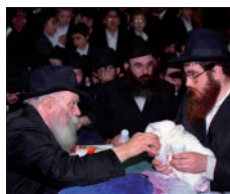
הרבי שליט"א מלך המשיח בחלוקת כוס של ברכה, מוצאי שבת י"ב סיון תשנ"א

...כללות העניין ד"תשלומין" מורה על אהבה יתירה וחסד נוסף מצדו של הקב"ה (מצווה המצוות) לבני ישראל, שאף על פי שלכתחילה נקבע הציווי לזמן מסויים, הנה גם כאשר בני ישראל לא קיימו את הציווי בזמן שנקבע מראש (מאיזו סיבה שתהיה), נותן להם הקב"ה - מפני גודל חסדו ואהבתו אליהם - הזדמנות נוספת שיוכלו להשלים את קיום הציווי, שזהו כללות העניין דימי התשלומין.