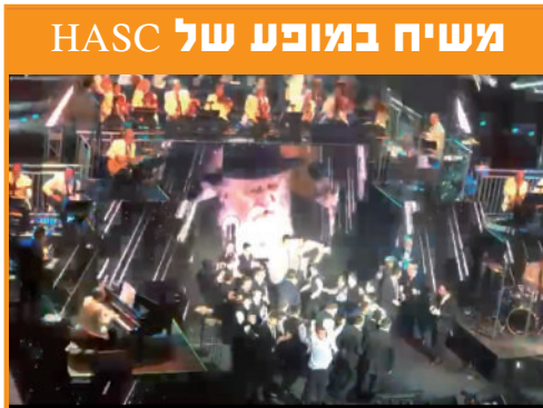
השבוע התקיים בניו יורק המופע הגדול של HASC, למען ילדים בעלי צרכים מיוחדים. וגעים בשירת "ברוך הבא מלך המשיח".

בשיחותיו הקדושות מרחיב הרבי שליט"א מלך המשיח אודות מעלתו היחודית של יוסף, כפי שבאה לידי ביטוי בקריאת שמו ע"י רחל אימו "ותקרא את שמו יוסף.. יוסף ה' לי בן אחר". מעבר לתפילה והאיחול שבדבריה שעוד תזכה לבן נוסף, יש בדבריה גם הצבעה על יכולתו של יוסף, לפעול גם על כאלה שהם בבחינת "אחר" ולעשותם ל"בן", בן לאבינו שבשמיים.