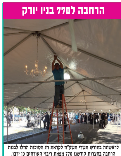
לראשונה בחודש תשרי תשע"ח לקראת חג הסוכות החלו לבנות הרחבה בחצרות קודשנו 770 מפאת ריבוי האורחים כן ירב.

בעולם הזה, עד זמן הגאולה לימוד התורה הוא באופן של שמייעה.