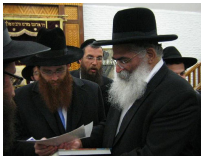
פסק הדין - לפי סימני הרמב"ם הרב הגאון יורם ע"ה אברג'ל חותם על פסק הדין שהרבי שליט"א הוא מלך המשיח.

לאור זאת, עלינו להבין את עצם כתיבת סימני הזיהוי למלך המשיח המופיעים בחיבור שמטרתו פסיקת הלכה לכל יהודי - סימנים אלו נועדו כדי להקל עלינו לזהות את מלך המשיח קודם התגלותו לעיני העולם כולו ובניית בית המקדש השלישי בגאולה האמיתית