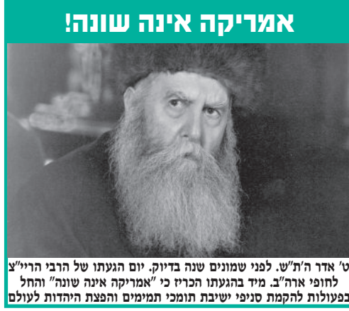
ט' אדר ה'ת"ש. לפני שמונים שנה בדיוק, יום הגעתו של הרבי הריי"צ לחופי ארה"ב. מיד בהגעתו הכריז כי "אמריקה אינה שונה" והחל בפעולות להקמת סניפי ישיבת תומכי תמימים והפצת היהדות לעולם

אז לא הבנתי למה כוונתו הק', אך כשראיתי שנקלעתי לכזו צרה שאין דרך