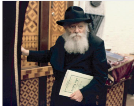
הרבי שליט"א מלך המשיח עם קונטרס 'דבר מלכות' של ימיו. הוקדשו לבאר את מעלתו של עם ישראל, וההבטחה שדורנו הוא דור הגאולה.

שמסרו נפשם על קדושת השם" בשנות השואה האיומה. הפסוק "לא תקום פעמיים צרה" מדגיש כי אין לאיים חלילה בעונשים מעין אלו על עם ישראל, וכי אין שייך לשפוט אף אחד מעם ישראל על הנהגתו, מכיוון שאנו במצב של העלם והסתגר והנסיונות הקשים שעברו על עמנו הם הרבה מעבר ליכולת הסבל של עם נורמלי ובוודאי שאין אנו יכולים לדון אדם אחר על מעשיו, וכבר חכמינו זכרונם לברכה "הוי דן את כל האדם לכף זכות". בנוסף לכך מדגיש את דברי הגמרא "אין לך אדם מישאל של לא קיים כמה וכמה מצוות" ו"כל ישראל מלאים מצוות כרימון". בשיחה זו קובע כי אין כל עניין המעבך חס ושלום את הגאולה העתידה.