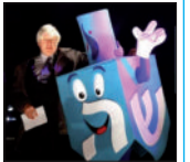
ג'ונסון באירוע חב"ד

בימים אלה של חודש כסלו חודש הגאולה, בפתיחת קונגרס משיח בלונדון, נבחר ראש ממשלה בריטי ימני בניצחון סוחף על יריבו האנטישמי.