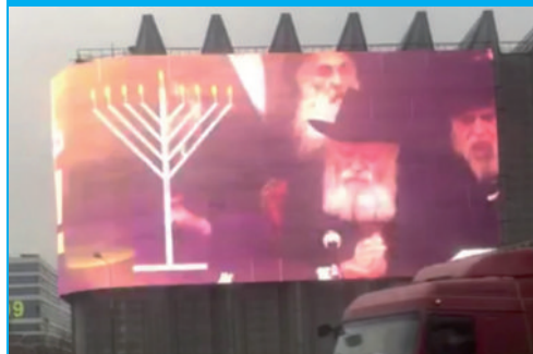
נצחון האור במקום החושך. השבוע בלב מוסקבה פרסומת ענק, עם וידאו מהרבי שליט"א מלך המשיח, לקראת ימי חג החנוכה.