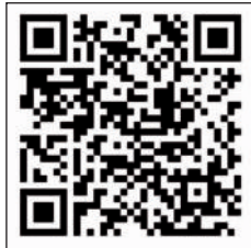
ברקוד רישום מנוי לערוץ