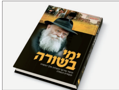
שער הספר החדש

בנשימה עצורה, מאזינים התלמידים לרבי יצחק המפליג בחזיונו ומספר על התגרויות מלכי העולם זה בזה, מתאר את אומות העולם המתרעשים ומתבהלים ואת עם ישראל הזועק בהיסטריה "להיכן נבוא ונלך", אז באה צפירת