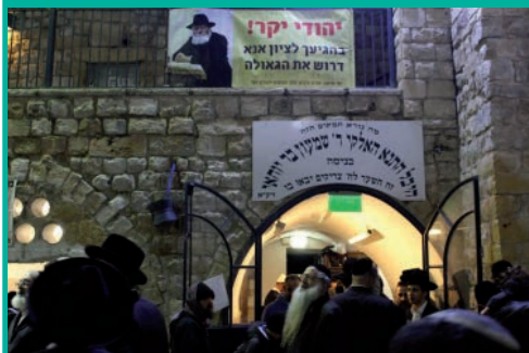
לרגל יום ז' באדר הילולת משה רבינו, התקיימה בציון רשב"י במירון, פעילות עניפה להתקשרות אל הרבי שליט"א מה"מ, ודרישה לזיווג הגאולה.