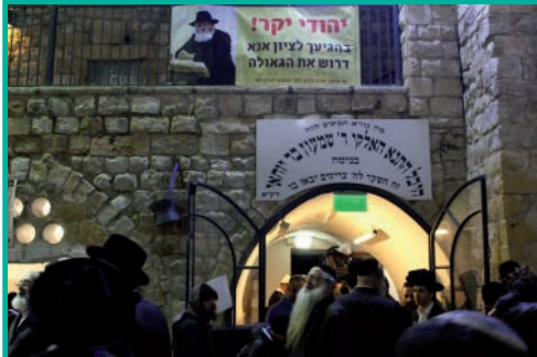
לרגל יום ז' באדר היולול משה רבינו, התקיימה בציון רשב"י במירון, פעילות עניפה להתקשרות אל הרבי שליט"א מה"מ, ודרשה לזיווג הגאולה.