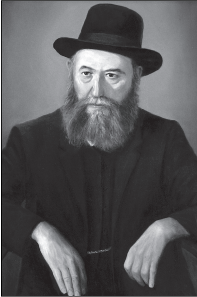
נשיא הישיבה - אדמו"ר מוהרש"ב נ"ע

האולם הקטן היה צמוד לבית גדול שעמד לרחבו של החצר, אשר היה ביתו ומדורו של אבי הרבי. באותו הפרק גרה שם אלמנתו, הרבנית רבקה נ"ע, אמו של הרבי. כזאת היו פני החצר. האולם הקטן עמד מול בית הרבי. העובר ביניהם עמד באמצע החצר הארוכה. משמאל, מאחורי ביתו של כ"ק אדמו"ר מהר"ש נ"ע, ניצב בית גדול ובו כמה חדרים גדולים. בחדר הראשון היה חדר האוכל של בני הישיבה ובחדר השני המטבח.