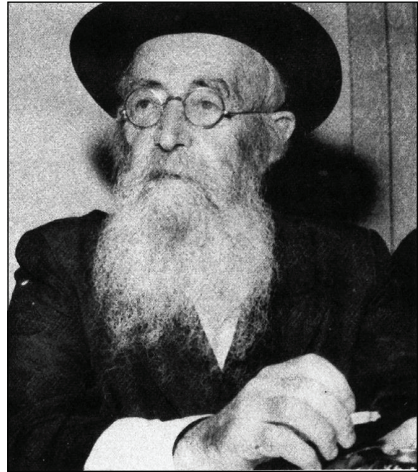
כותב השורות הרנ"ש ששונקין

נפגשתי עם בחורים שבאו מטלז, וולוז'ין וכו' והנה כולם קצוצי פאה, מגדלי בלורית, ומתאוננים על גורלם על כי חניכי ישיבות המה, ומה יהא עליהם בתכליתם?! הללו החליטו ללמוד חכמות חיצוניות, מתוך תקוה להיות רופא, עורך־דין וכדומה. כאשר שמעתי את דבריהם, גמרתי בלבי שלא לנסוע לישיבות אלו - אף שהבנתי כי לא כל בני הישיבות כמוהם - שכן נוכחתי שרוח ההשכלה כבר חדרה לתוך בית מדרשם, ויראתי לנפשי שלא תפגע גם בי.