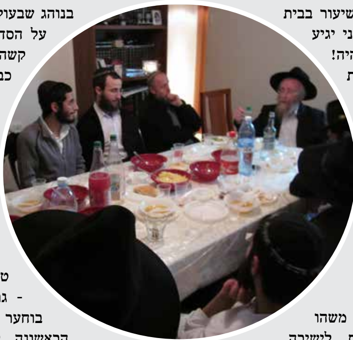
אחת מאותן התוועדויות הכנה לקבוצה

לא הסתפקת בזה - באחד בשיעורי החסידות הכרות בפאתוס "חברותא שתלמד מאמר 3 פעמים תבוא