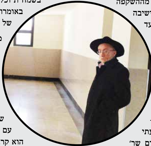
בביקורו האחרון בזאל הישי"ק לפני פתיחתה.

אחר כך שאל מה השעה? אמרתי לו השעה כבר אחרי צאת הכוכבים. ורטן בפני 'למה לא העירו אותי למנחה, הרי סיכמתי שיעירו אותי למנחה?!' הסברתי לו בפרוטרוט את המצב שהיה לו ושכולם מגדירים את זה שהתעורר כנס. לאחר כמה זמן אמר כמתנצל "מעולם לא קרה לי כזה דבר שלא התפללתי מנחה" (!). וכמה זה קשה לו שלא העירו אותו (אני בליבי חשבתי ר' זלמן במצבך אתה פטור וכל פסוק או ברכה בודדת שאתה אומר, הקב"ה מקבלה כתפילה שלימה בזמנה, אך לא העזתי לומר זאת) אמר "אם כן מותר לי להתפלל עכשיו מנחה".