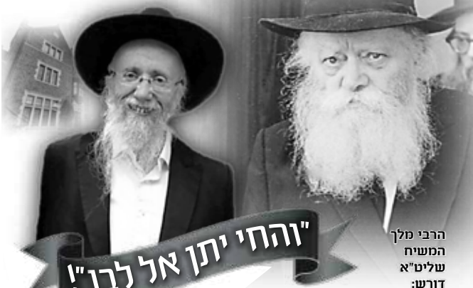
הרבי מלך המשיח שליט"א דורש: